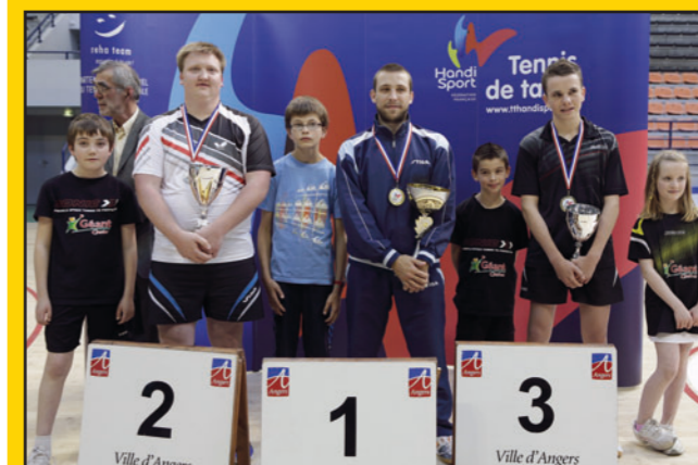
Podium 2013 Simples Messieurs Debout