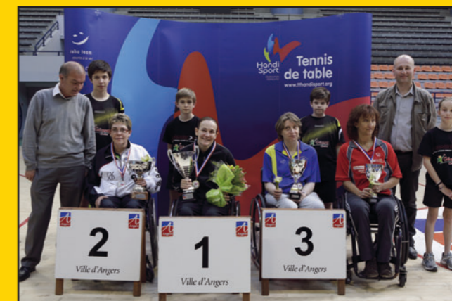
Podium 2013 Simples Femmes Assises