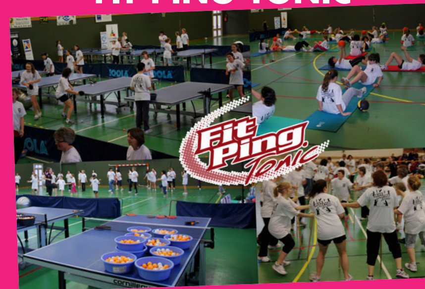
Ici, la démonstration réalisée par le comité du Loiret. Echauffement chorégraphié, ateliers de jonglages, de panier de balles, de renforcement musculaire et d'assouplissements.

proposer plus ou moins de pratique de tennis de table dans la séance (variation de 20 et 60%), choisir le créneau le plus adapté au contexte local (différent pour un club rural ou urbain, différent pour des pratiquantes mineures ou majeures).