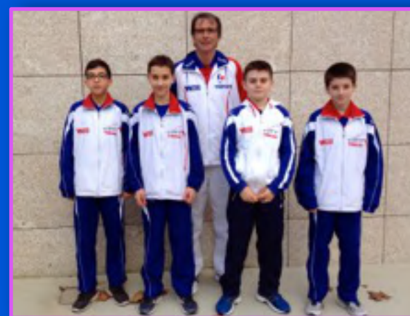
Vainqueur par équipe à l'Open du Portugal