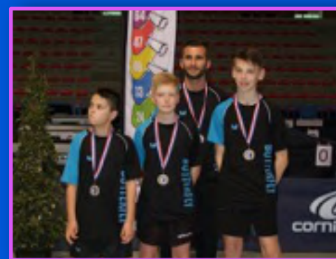
Médaille de bronze aux Championnats de France des Régions Minimes