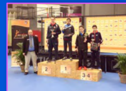
Vainqueur à l'Open de Belgique