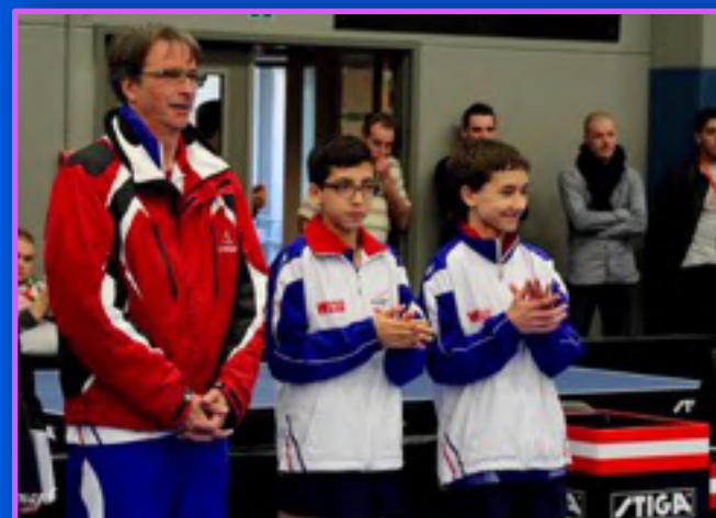
Vainqueur par équipe à l'Open de Belgique