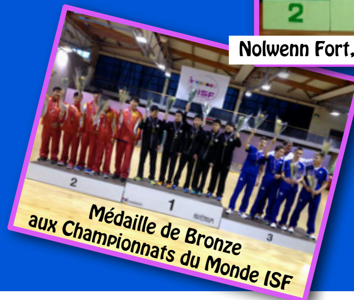
Médaille de Bronze aux Championnats du Monde ISF