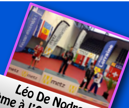
Léo De Nodrest 3ème à l'Open de France