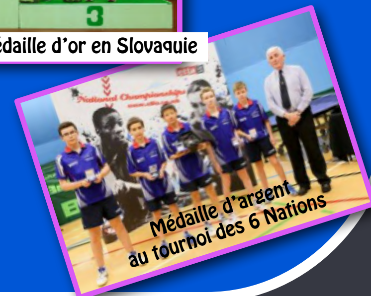
Médaille d'argent au tournoi des 6 Nations