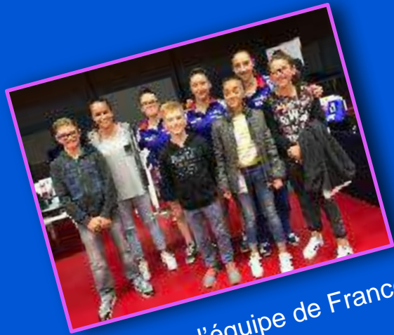
Match avec l'équipe de France féminine