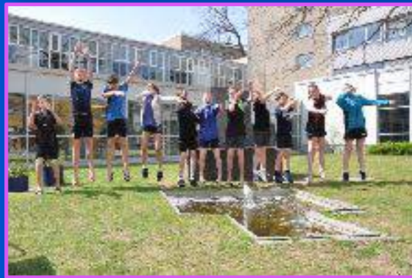
Stage en Allemagne