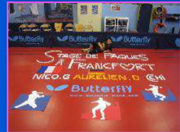
Chichi : Une nouvelle passion!