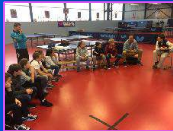
Intervention et réflexion sur la citoyenneté