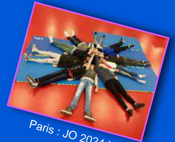
Paris : JO 2024 !