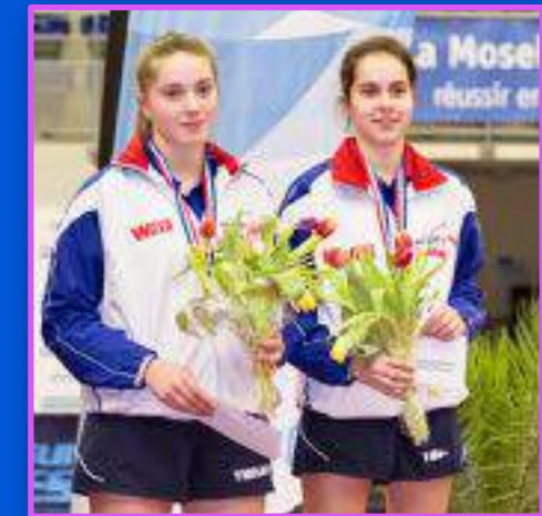
Médaille de bronze en double à l'Open de France : Nolwenn F.